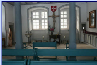
Schlosskapelle St. Johannis